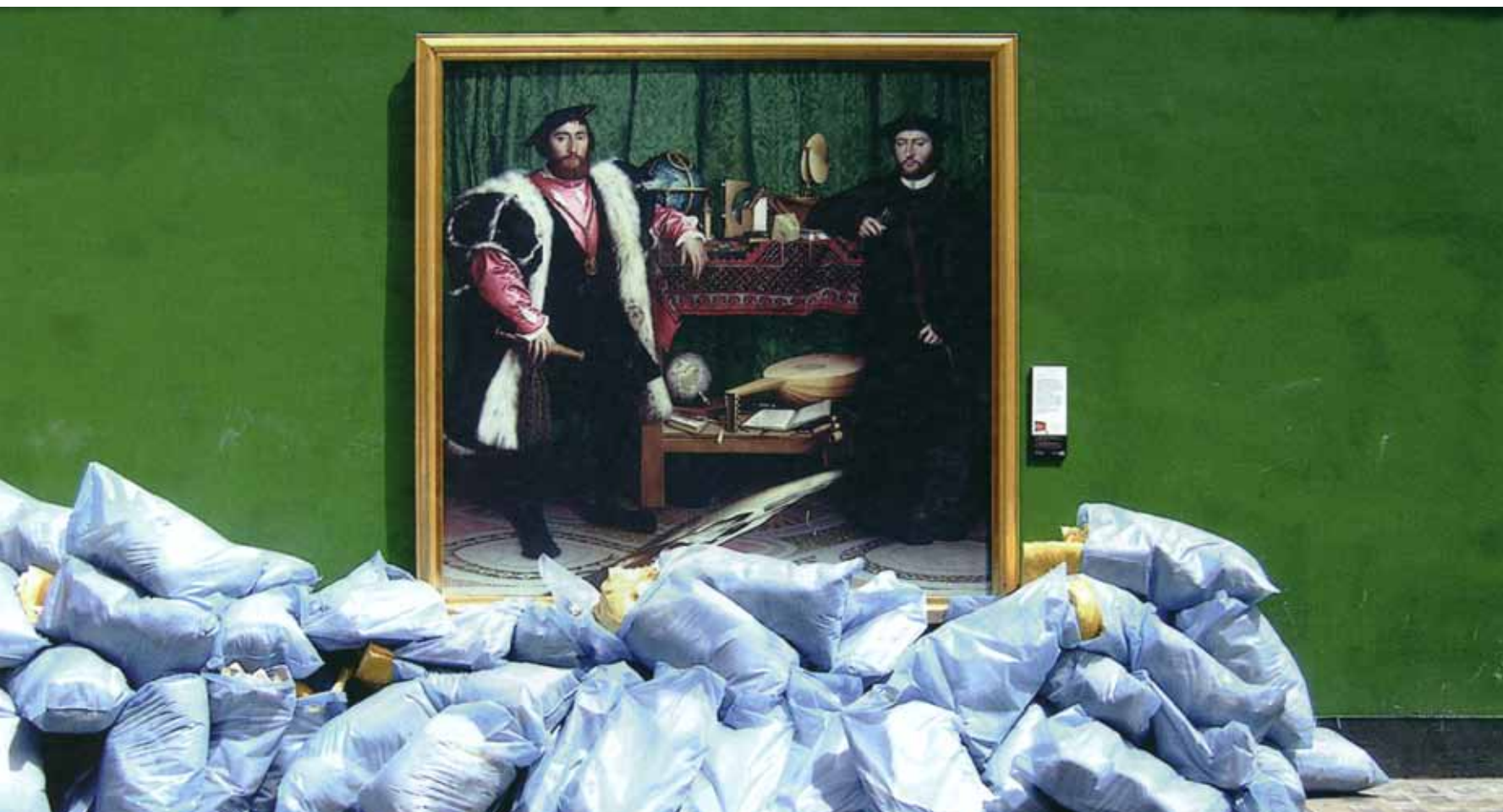
Wem steht der Urheberrechtsschutz zu? National-Gallery-Reproduktion in Soho.

Text: Rena Zulauf, Marcel Kaufmann*